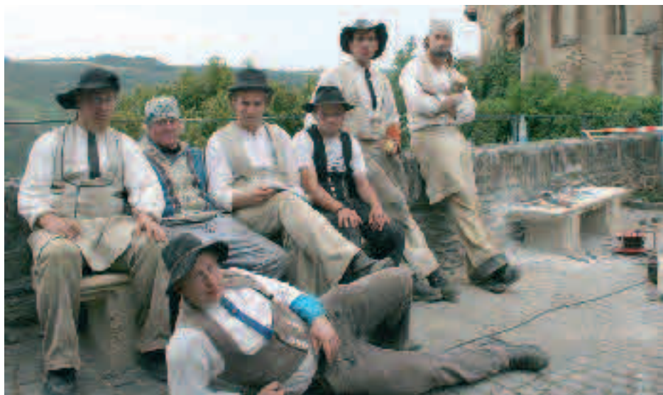
Kleine Steinmetz-Pause in Oberwesel an der Schönburg.