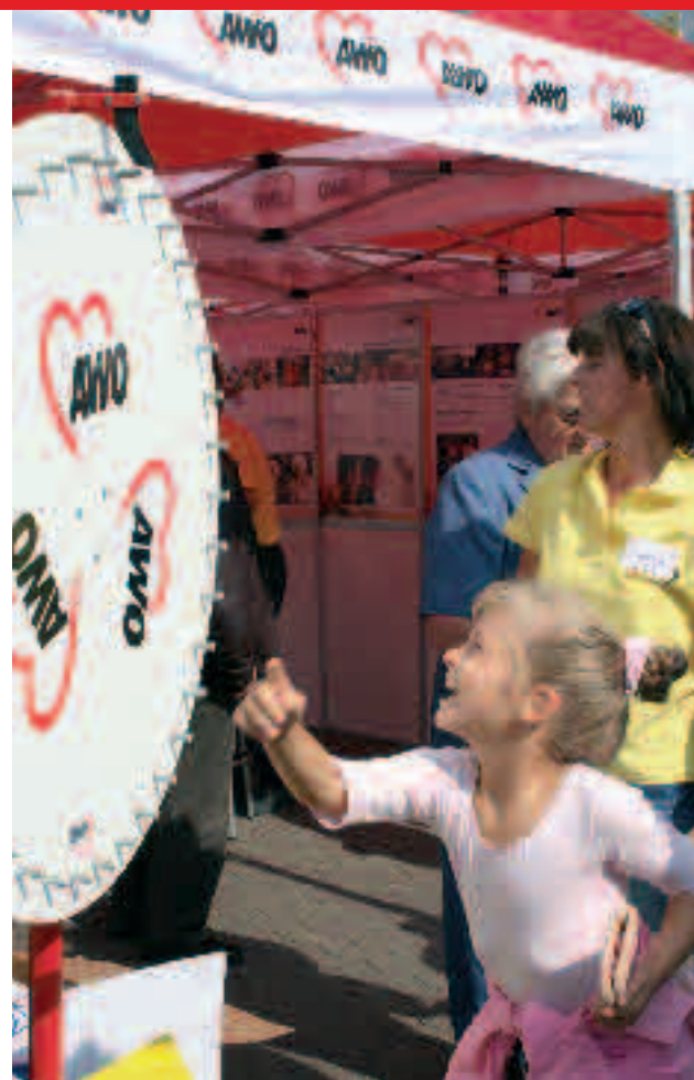
Glücksrad dreh dich!

Das in der Überschrift genannte Motto „Bei der AWO kommen wir uns Nahe“ wurde umgesetzt und bestätigt. (ah)