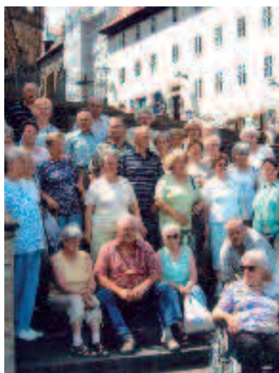
Reisegruppe aus Neuwied.

Der Ortsverein Niederbieber-Sengendorf war sieben Tage in Thüringen unterwegs. Ausgangs- und Zielort für Ausflüge war jeweils die Stadt Mühlhausen.