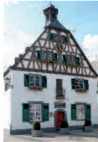
Altes Rathaus mit neuen Inhalten.