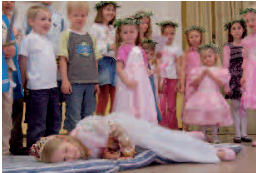
Märchenbaft - Tänze der Kleinsten in Worms-Leiselheim.