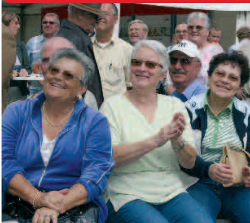
Es hörten (fast) alle zu.