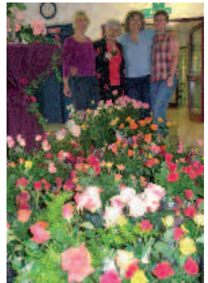
Rosenglück in Wörrstadt.