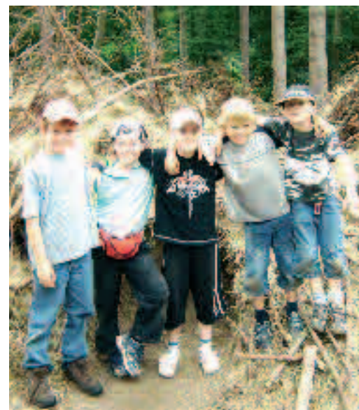
Kinderstolz: Die Waldbütte haben wir selbst gebaut.

Die Kinderstadtranderholung des Ortsvereins erfreute 170 Kinder.