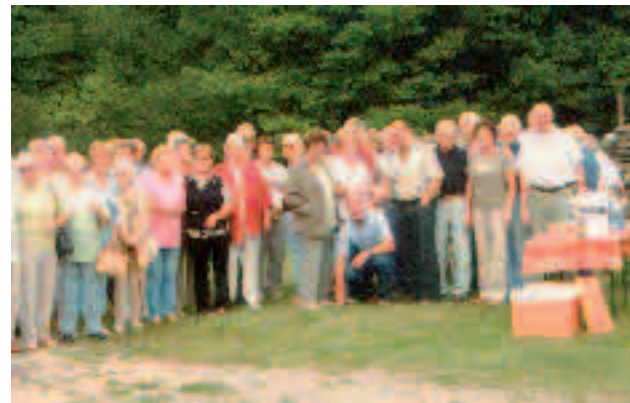
Zwischenstopp im Naturpark Spessart.

Der Ortsverein unternahm einen Tagesausflug nach Gelnhausen in den Spessart und Lohr am Main. 60 Teilnehmer!