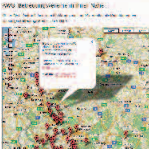
„Ehrenamt im Netz“.