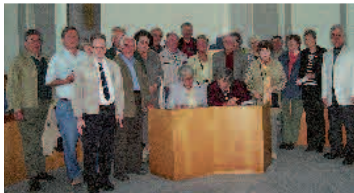
Besuch um Landtag, Bad Breisig warfen Blick in Landesparlament.

Auf Einladung von Landtagsabgeordnetem Bernd Lang fuhr der Ortsverein nach Mainz; Besuch im Landtag und bei der Firma Schott; anschließend nach Rüdesheim zum Niederwald-Denkmal; Rückfahrt durch Rheinhessen und auf der rechten Rheinseite.