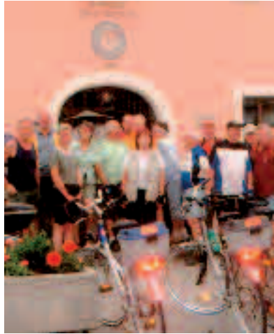
Rast vorm Rathaus in Dietfurt im unteren Altmühltal.

Mitglieder des Ortsvereins Worms-Mitte taten sich mit Bürostädter Freunden zusammen, sie unternahmen eine 4-Tage-Radtour durch das Altmühltal.