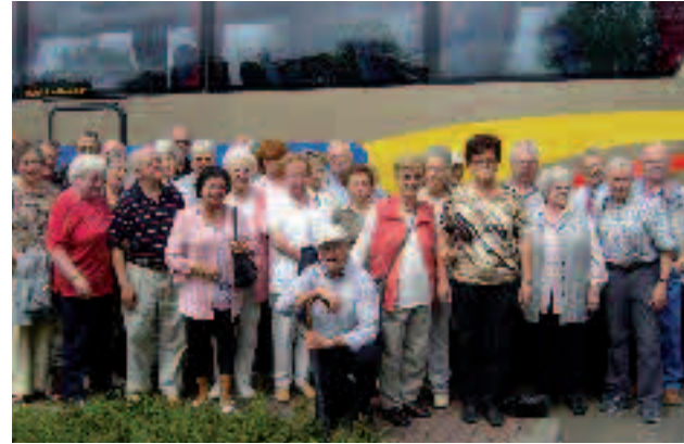
Reisegruppe aus Koblenz-Arzheim.

Der Ortsverein war in der Uckermark, in Berlin und an der Ostsee unterwegs und hat die besten Erinnerungen an die schöne Reise.