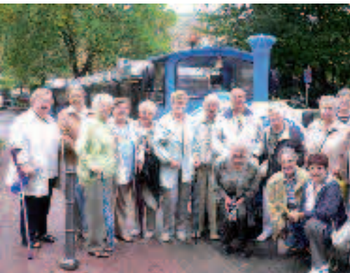
Der Blaue Klaus nahm die Stromberger von Bad Kreuznach nach Bad Münster-Ebernburg mit.

Der Ortsverein war mit 18 Teilnehmern zu einem Ausflug nach Bad Kreuznach und Bad Münster-Ebernburg unterwegs.