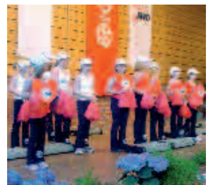
Eine Mädchen-Tanzgruppe des Mombacher Turnvereins brachte Schwung in die 25-Jahr-Feier.

cher Männer-Gesangverein unter Leitung von Ingrida Schwedass. (ws)