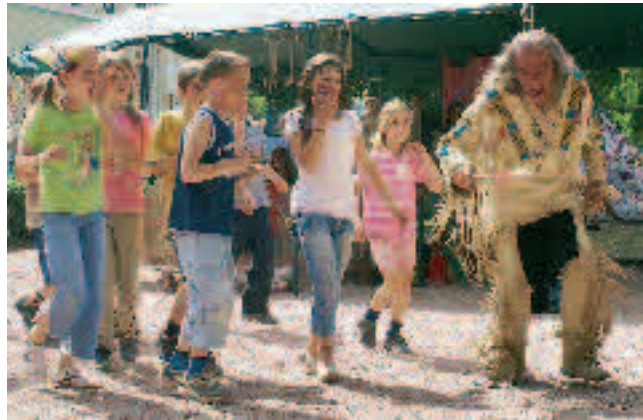
Indianertanz mit Gebrüll.

Ferien vor Ort. Dem Wetter getrotzt, Tipi-Zelte gebaut, Perlenketten aufgefädelt, verkleidet, geschminkt, Bungee-Running, viel über das richtige Indianerleben erfahren: Erlebnistage am Rhein.