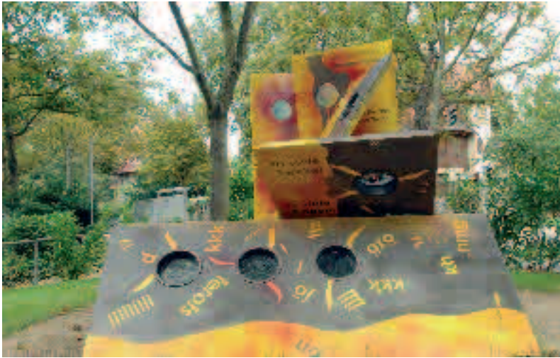
Die dunklere Seite des Kunstwerkes Demenz.

Erstes Kunstwerk zum Thema Demenz steht in Mainz