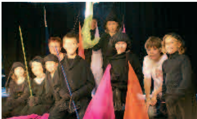
Märchenhafte Möglichkeit: Schwarzlicht-Theater.