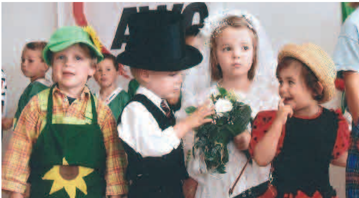
Modenschau der Kinder.