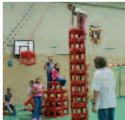
Hoch binaus ging`s beim Markt der Möglichkeiten.

Boppard. „Markt der Möglichkeiten“ hieß ein neuartiges Ferienangebot für Schüler der Stadt. Stadtverwaltung, Kreisverwaltung Rhein-Hunsrück und das Projektbüro der AWO organisierten zwei Wochen lang ein offenes, buntes Angebot auf dem Gelände und in den Räumen der Fritz-Strassmann-Schule. Markt-Anbieter waren MitarbeiterInnen der AWO, des Hauses Niedersburg, der Jugendbegegnungsstätte, Vereinsmitglieder