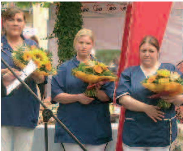
Dank und Anerkennung zur bestandenen Prüfung. Altenpflegerinnen und -helferinnen.

Mittelpunkt der Pflege stellt. Die Einrichtung öffnete sich anderen Gruppen der Gesellschaft, sagte Kuhl. Dies führe durchweg zu positiven Erfahrungen auf allen Seiten. Er beschrieb unter anderem die Kooperation mit der Integrierten Gesamtschule. An einzelnen Nachmittagen betreuen Schüler der „Sozial AG“ Bewohner des Seniorenzentrums. Hagemann lehnte im Gespräch über eine Reform der Pflegeversicherung die sogenannte „Kopfpauschale“ ab. Er bevorzuge einen Pflegeversicherungsbeitrag, der an die Einkommenshöhe gekoppelt ist, sagte er. (ah)