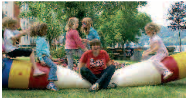
Frohe Kinder in den Rheinanlagen.