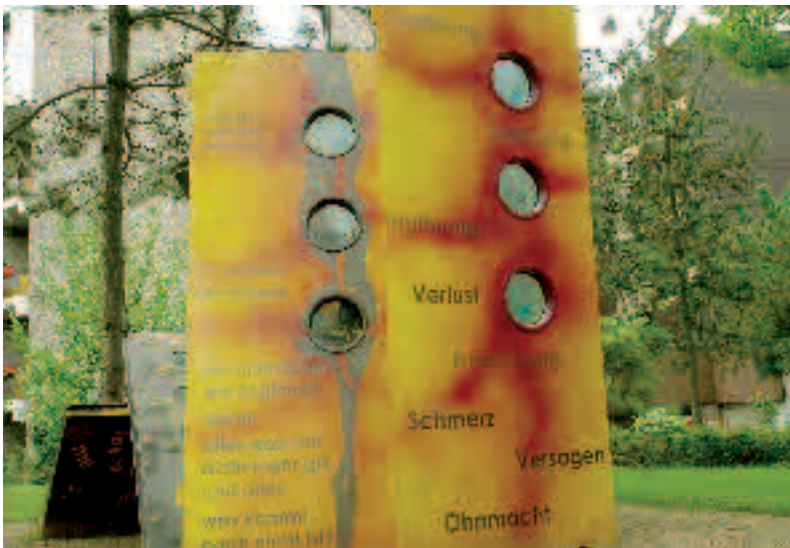
Kunstwerk Demenz in Mainz; die hellere Seite.