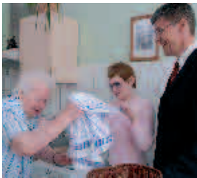
Rein in die Maschine - mit Schwung.

Worms. Das Energie-Versorgungsunternehmen EWR spendete dem Seniorenzentrum „Remeyerhof“ eine Waschmaschine. Eine besondere. Denn die Befüllung erfolgt von oben her. Dies war gewusst so gewählt, weil die Maschine vor allem im Lebensbereich älterer dementer Bewohner eingesetzt wird. Und diese Bewohner sind es gewohnt, die Waschmaschine oder die Waschkessel von oben zu befüllen. Gerade diesen Bewohnern wird eine ihnen möglichst vertraute Umgebung geschaffen, damit sie sich wohl und heimisch fühlen. Die neue Maschine ist hierzu ein Mosaikstein.